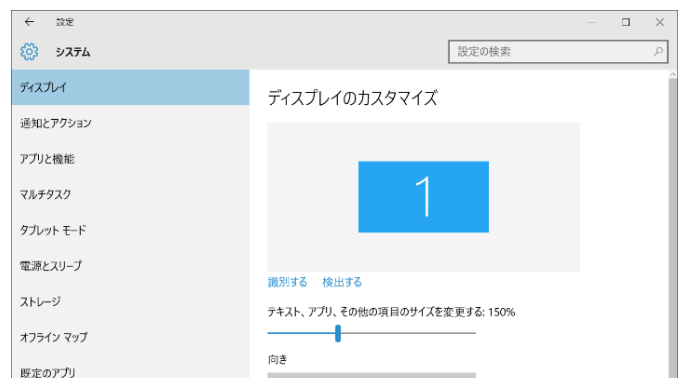
Windows10の場合：設定>システム>ディスプレイ